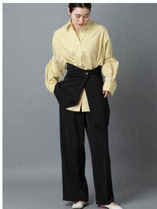
コルセット付きパンツ