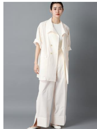
シャツの袖をイメージしたパンツ