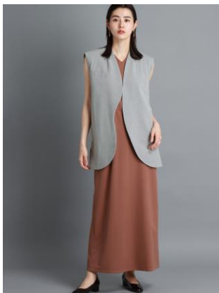
『CIS.』の字をカーブで表現したジレ